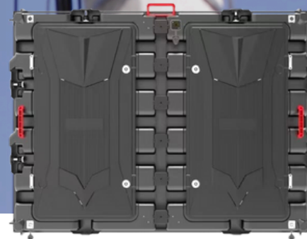
IG10+ 960mm x 1260mm