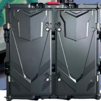
IG 960mm x 960mm